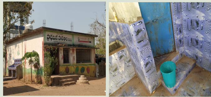
హైదరాబాద్ పల్స్ న్యూస్, మార్చి 26, కొమురం భీం ఆసిఫాబాద్ జిల్లా ప్రతినీధి:

ఆసిఫాబాద్ జిల్లా వాంకిడి మండలం సరండి గ్రామంలోని ప్రాథమిక పాఠశాలలో మౌలిక సదుపాయాల కొరత తీవ్రంగా ఉందని తల్లిదండ్రులు మరియు గ్రామస్థులు ఆందోళన వ్యక్తం చేశారు. తాగునీరు, మరుగుదొడ్లు సరిగా లేకపోవడంతో విద్యార్థులు తీవ్ర ఇబ్బందులు పడుతున్నారు. పాఠశాల ఆవరణలో ఉన్న నీటి గుంత చిన్నారలకు ప్రమాదంగా మారింది. పాఠశాల నిర్వహణపై కూడా విమర్శలు వెల్లువెత్తుతున్నాయి. ప్రధాన ఉపాధ్యాయుడు సమయపాలన పాటించడం లేదని, బాధ్యతారాహిత్యంగా వ్యవహరిస్తున్నారని తల్లిదండ్రులు ఆరోపించారు. సమస్యలను వెంటనే పరిష్కరించి మౌలిక వసతులు కల్పించాలని, అధికారులు పాఠశాల నిర్వహణపై విచారణ జరిపి తగు చర్యలు తీసుకోవాలని గ్రామస్థులు అధికారులను కోరుతున్నారు