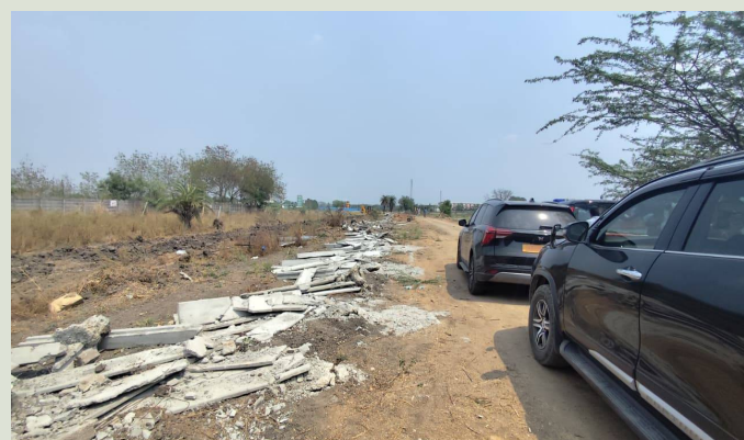
పటాన్ చెరు, హైదరాబాద్ పల్స్ న్యూస్, మార్చి 26 :

సంగారెడ్డి జిల్లా పటాన్ చెరు నియోజకవర్గం పటాన్ చెరు (మం) పాటి గ్రామంలోని ఆనంద్ నగర్ కాల్నీలో అనుమతిలేని ప్రహారీ గోడలు, పెద్ద కూల్చివేసిన హైడ్రా, మండల రెవెన్యూ అధికారుల యంత్రాంగం. పాటి గ్రామం సర్వే నంబర్ 185, 186, 187, 239, 243, 245, 246, 247 నుంచి 250 లలో గల ఫ్లాట్లు కొనుగోలు చేసిన బాధితుల ఫిర్యాదు మేరకు సీనియర్ ఘోషాని పరిశీలించిన హైడ్రా కమిషనర్ రంగనాథ్. ఫ్లాట్ల ఓనర్లకు న్యాయం చేస్తామని హైడ్రా కమిషనర్ ఏవి రంగనాథ్ ఇచ్చిన భరోసా మేరకు బారీ పోలీసు బందోబస్తు మధ్య కూల్చివేతలు చేపట్టిన అధికార యంత్రాంగం.