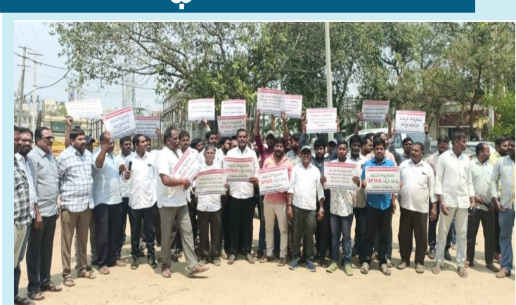
పటాన్ చెరు, హైదరాబాద్ పల్స్ న్యూస్, మార్చి 26 : విద్యుత్ సంస్థలో పని చేస్తున్న కార్మికుల సమస్యల మీటర్ రీడింగ్ వరల్డను మరియు పోల్ టు పోల్

వరల్డను కోసం బి.పి.ఎ.ఈ. జేపీసీ రి తెలంగాణ విద్యుత్ ఆర్టిజన్ ఎంప్లాయిస్ జాయింట్ యాక్షన్ కమిటీ ఆధ్వర్యంలో సమ్మె సైరన్ మోగింది గురువారం పటాన్ చెరు డివిజన్ కార్యాలయం ఎదుట రాష్ట్ర విద్యుత్ జాయింట్ యాక్షన్ కమిటీ పిలుపుమేరకు ధర్మా కార్యక్రమం నిర్వహించడం జరిగింది. ఆర్టిజన్ కార్మికులకు ప్రభుత్వం నిబంధన ప్రకారం ఏపీఎస్సీబి రూల్స్ వర్తింపజేయాలని, సమాన పనికి సమాన వేతనం అందజేయాలని. ఆర్టిజన్ కార్మికులను విద్యార్థతను బద్ధి కన్వర్షన్ చేయాలని మరియు వరల్డను మరియు పోల్ టు పోల్