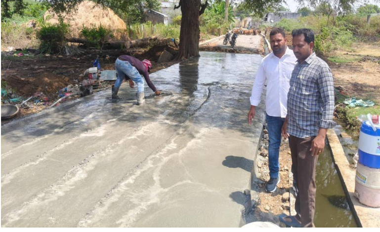
హైదరాబాద్ పల్స్ న్యూస్, ఏప్రిల్ 08, మహబూబాబాద్ జిల్లా ప్రతినీధి :

11వ వార్డులో మౌలిక వసతుల పనులు శరవేగంగా, ప్రజల ప్రశంసలు