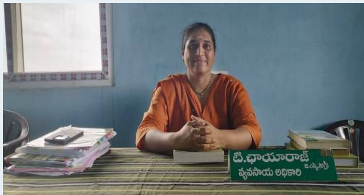
హైదరాబాద్ పల్స్ న్యూస్, ఏప్రిల్ 08, మహబూబాబాద్ ప్రతినీధి :